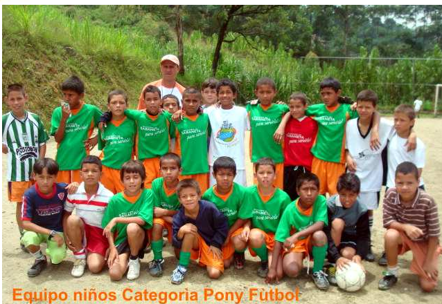
Equipo niños Categoría Pony Fútbol